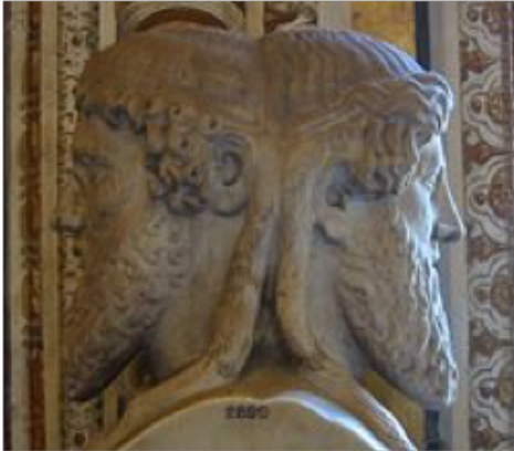
Dios romano Janus Bifronte en el Museo Vaticano