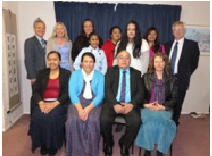
Cristianos después de los servicios de la iglesia en Nueva Zelanda

¿Debería usted ‘vestirse’ cuando usted asiste a los servicios de la iglesia?