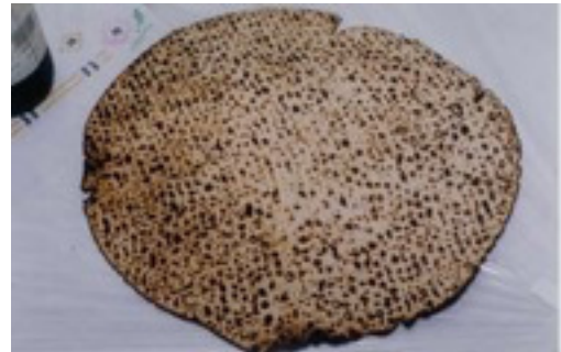
Pan sin levadura