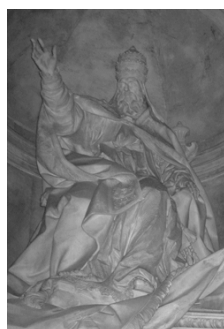
Papa Gregorio 13 (Reinó de 1572 a 1585)

Además, el tipo de calvicie que muchos monjes budistas y católicos se han impuesto a sí mismos es directamente contrario a los estatutos de la Biblia (Levítico 21: 1,5; Ezequiel 44: 15,20), así que tenga cuidado de no imitarlos.