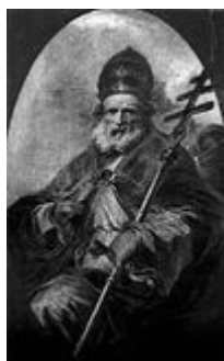
Papa León I (Reinó de 440 a 461)