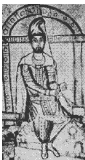
Sacerdote de Mithras (Siglo 3o)

Si ve a algún hombre orando con la cabeza cubierta como la que usaban los paganos, puede estar seguro de que no cree que deba tomar pasajes de la Biblia tales como los de 1 Corintios 11 literalmente. Pero usted debería hacerlo.