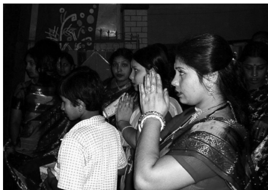
Hindúes rezando a la diosa Durga (por Hasan Iqbal Wamy)

En cuanto a las otras posiciones, algunas personas, debido a una enfermedad física, no pueden arrodillarse o incluso ponerse de pie. La capacidad de Dios para escuchar y responder a las oraciones no está limitada por tales circunstancias.