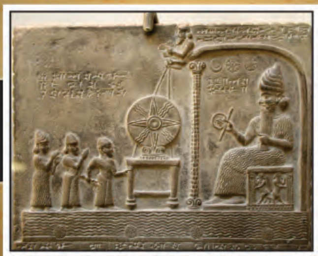
Sacerdotes rezando ante el símbolo del sol y Shamash.

Sin embargo, en ninguna parte de la Biblia se menciona a los cristianos que sostienen las manos con las palmas de las manos y los dedos apuntando hacia arriba, como se muestra en muchos cuadros o artefactos religiosos, como el de los sacerdotes babilónicos orados que rezan al dios sol Shamash alrededor del 888 a. C.