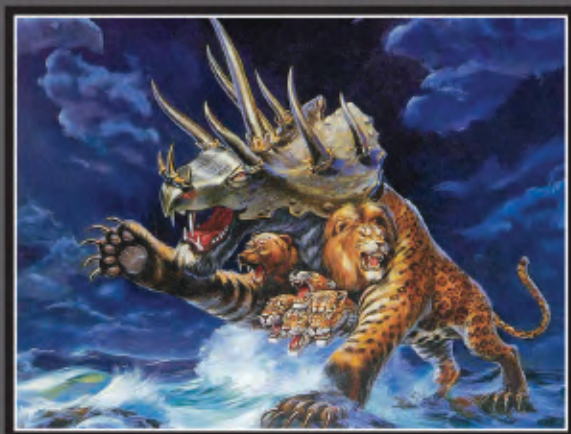
Representación de la Iglesia de Dios de la Radio de la Bestia del Mar (Apocalipsis 13)

While many claim to keep the Ten Commandments, because of "traditions of men," misunderstanding scriptures, and following improper teachings (cf. Matthew 15:1-9), almost none who claim to be Christian truly strive to properly keep them.